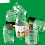
POTS ET BOCAUX EN VERRE