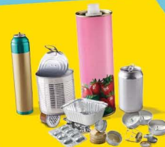
EMBALLAGES EN MÉTAL, MÊME LES PETITS