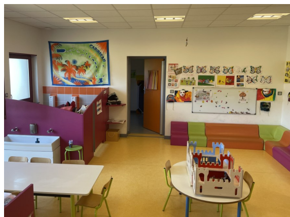
La salle d'activités des - de 6 ans