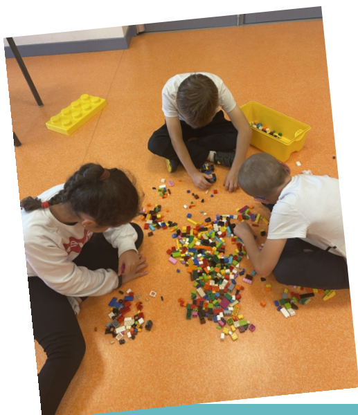
Temps calme Lego

inscriptions-farfadets@pays-beaumedrobie.com