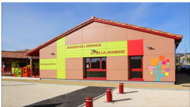
La maison de l'enfance et de la jeunesse

Le centre de loisirs intercommunal « Les Farfadets » est une structure gérée par la Communauté de Communes du Pays Beaume-Drobie. Elle accueille les enfants de 3 à 11ans dans les locaux de la Maison de l'Enfance et de la Jeunesse, à Lablachère.