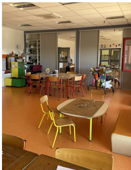
La salle d'activités des + de 6ans