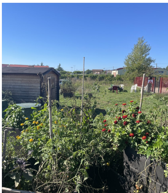
Le jardin partagé de la Maison de l'Enfance et de la Jeunesse