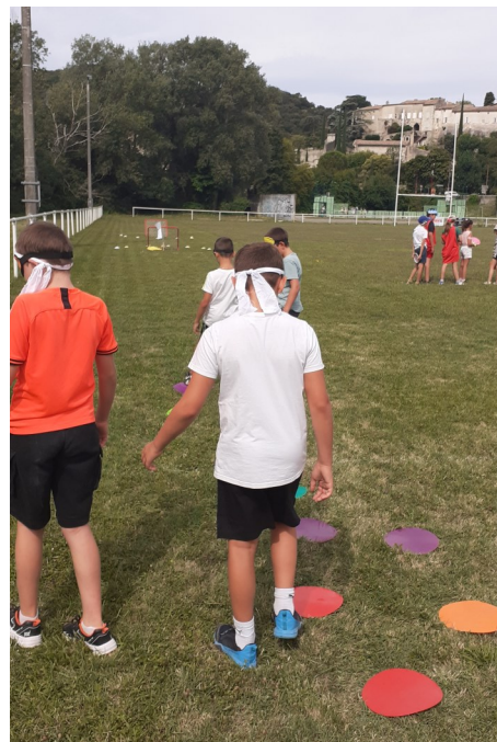
Journée intercentre à Vivier